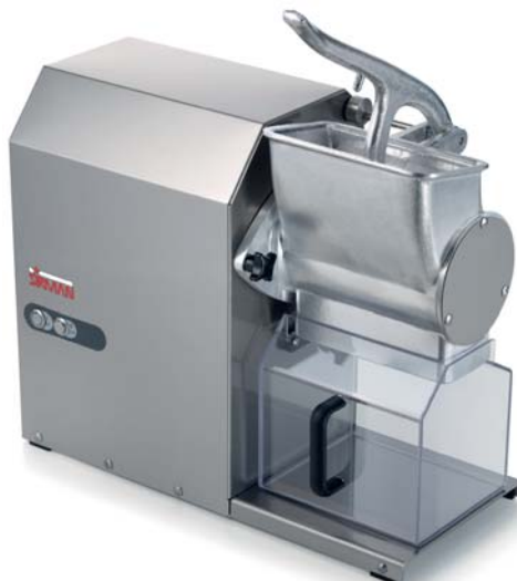
GFX HP 2