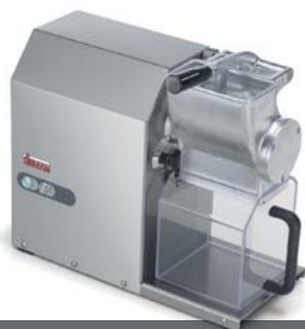
GFX HP 1,5