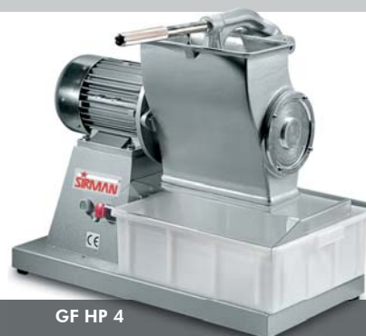
GF HP 4