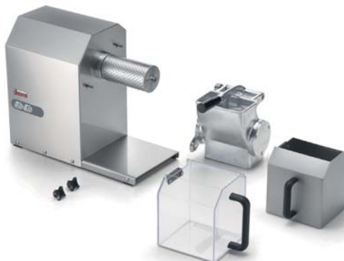
GFX HP 1.5-2